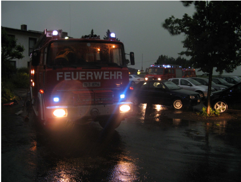
Einsatzfahrzeuge aus Lich und Muschenheim vor dem Landhaus Klosterwald

Lich (ak). Ein schweres Gewitter mit sintflutartigen Regenfällen hat am Freitagabend für Chaos in Hessen gesorgt. Auch das Stadtgebiet von Lich war davon betroffen. Innerhalb kürzester Zeit fielen teilweise über 50 Liter Regen pro Quadratmeter auf den ausgetrockneten Boden.